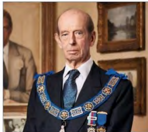
HRH THE DUKE OF KENT KG, GCMG, GCVO, ADC

Im zweiten Teil kamen schließlich der Grand Master, der Pro-Grand Master, der Deputy Grand Master und der Assistant Grand Master begleitet von großem Geleit auf die Bühne und aus der Royal Albert Hall wurde ein in einem FM Tempel nicht unähnlicher Saal.